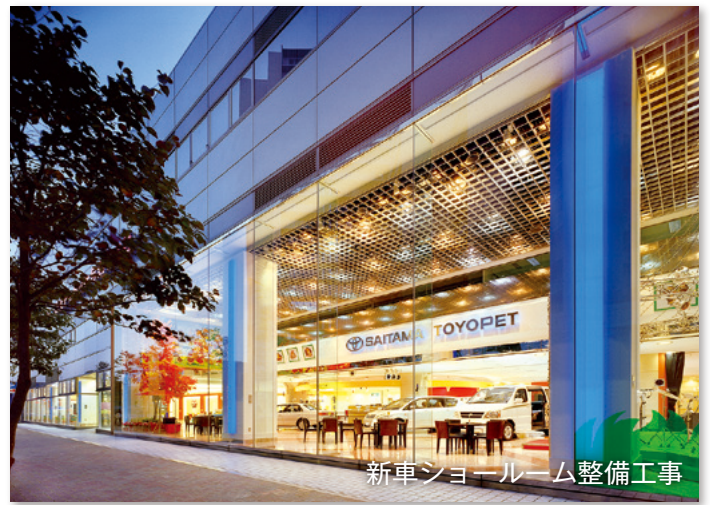
新車ショールーム整備工事