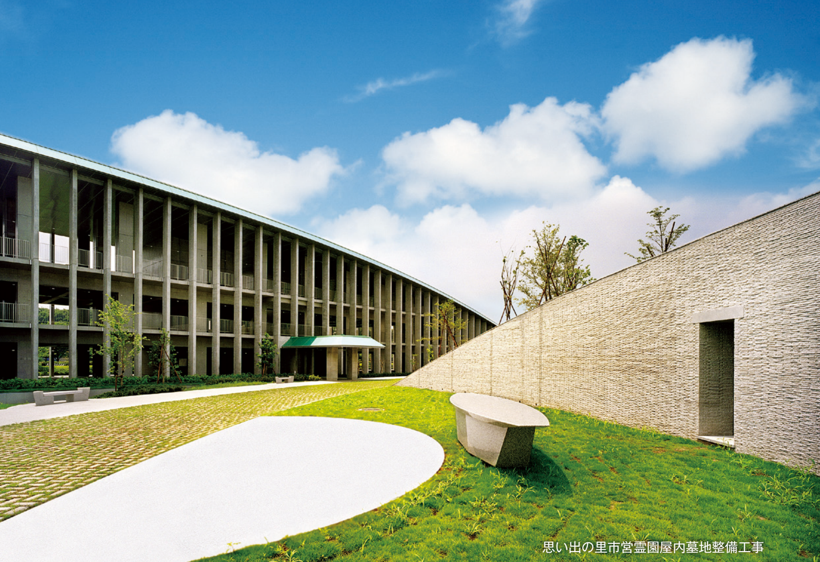
思い出の里市宮霊園屋内墓地整備工事