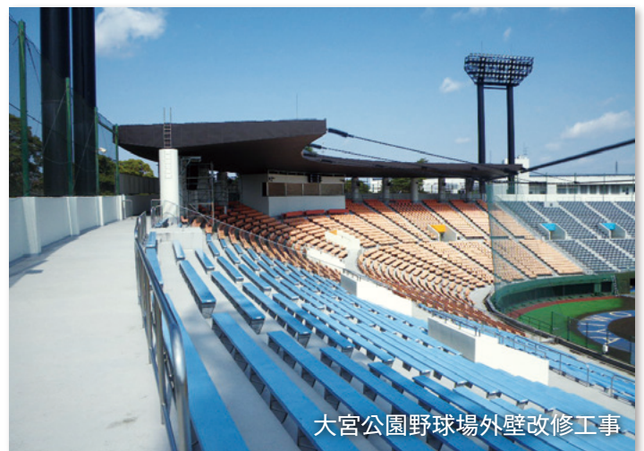
大宮公園野球場外壁改修工事