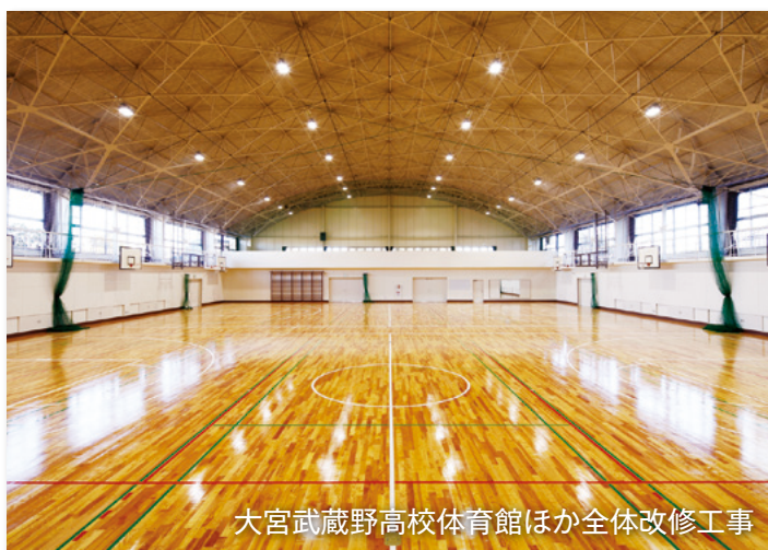
大宮武蔵野高校体育館ほか全体改修工事