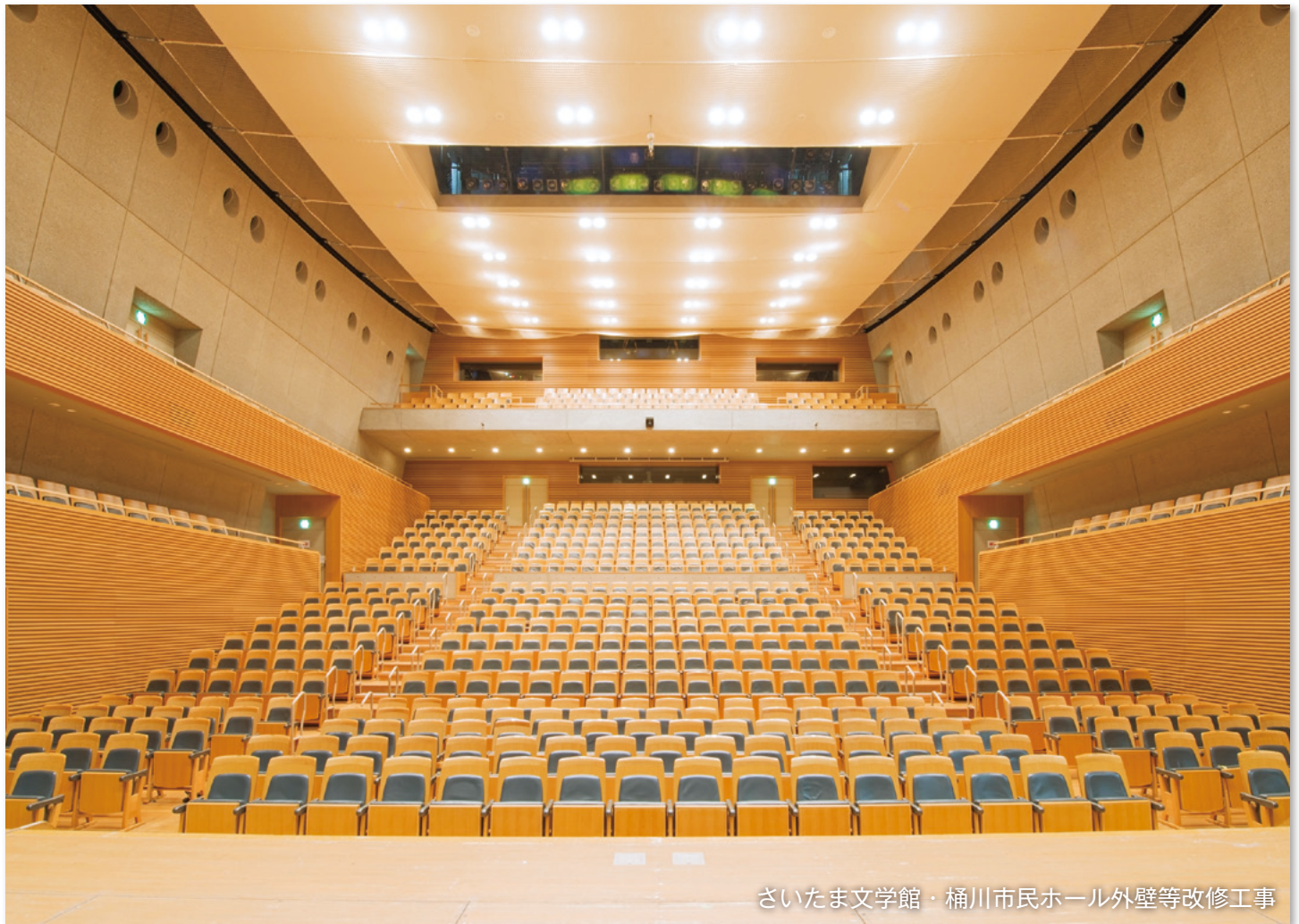
さいたま文学館・桶川市民ホール外壁等改修工事