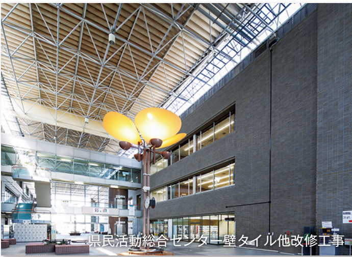
県民活動総合センター壁タイル他改修工事