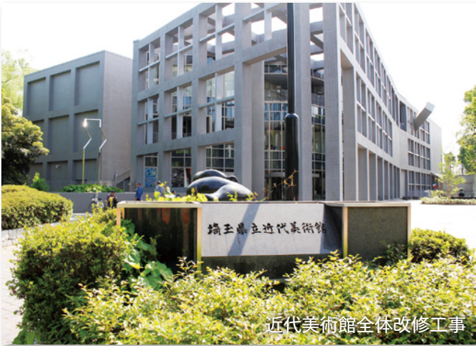
近代美術館全体改修工事