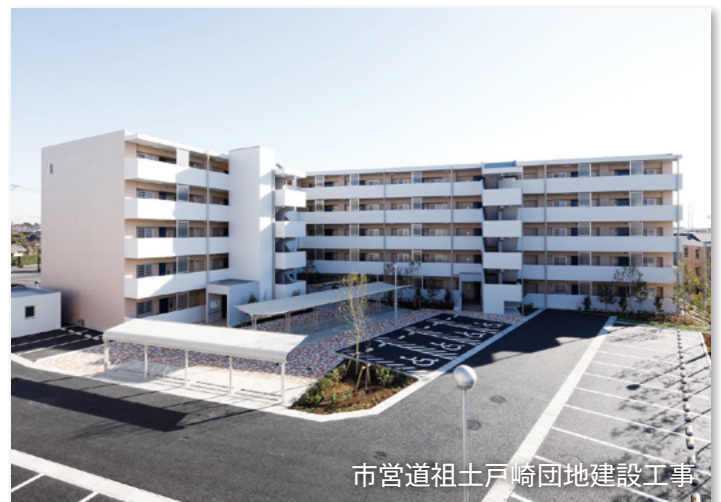
市営道祖土戸崎団地建設工事