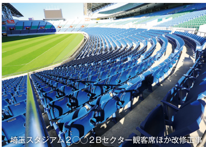
埼玉スタジアム2002Bセクター観客席ほか改修工事