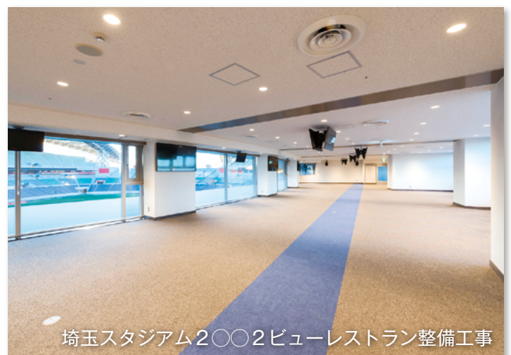
埼玉スタジアム2002ビューレストラン整備工事