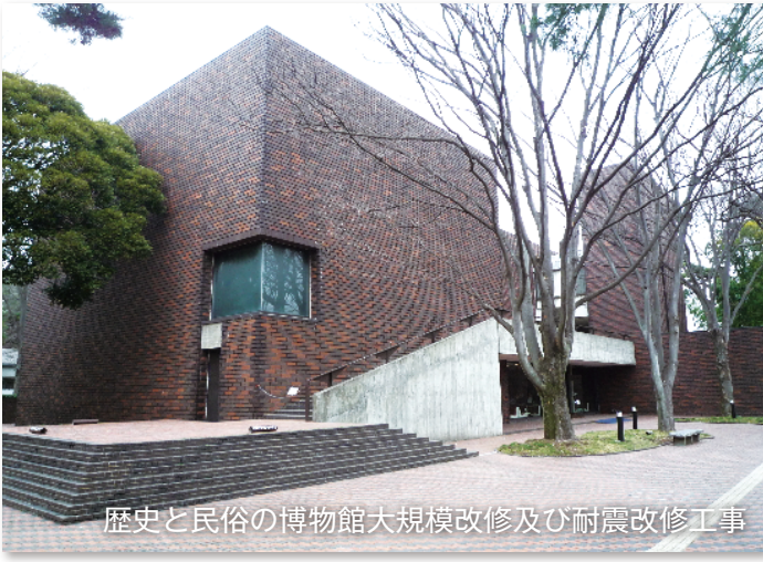
歴史と民俗の博物館大規模改修及び耐震改修工事