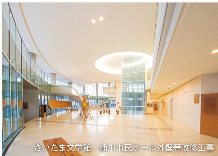
さいたま文学館・桶川市民ホール外壁等改修工事