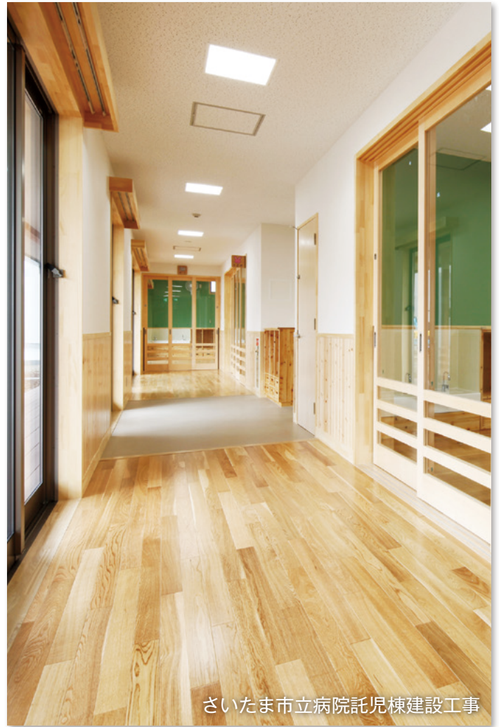
さいたま市立病院託児棟建設工事