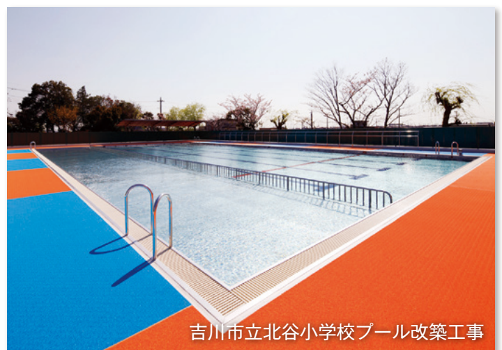
吉川市立北谷小学校プール改築工事